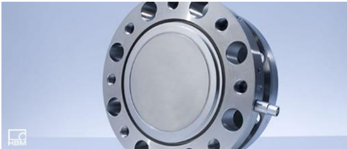
Рисунок 2. Общий вид датчика крутящего момента силы ТВ2

Общий вид датчика крутящего момента силы ТВ2 представлен на рисунке 2.